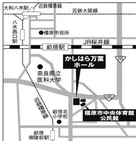
かしはら万葉ホール